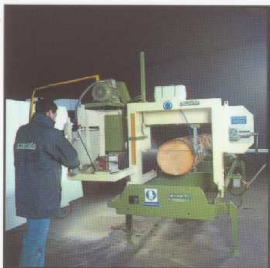
Timber Queen S bâti de coupe avec opérateur aux commandes