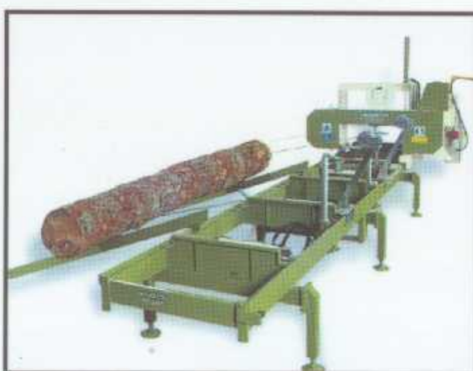
Timber Queen S chargement de grumes Timber Queen S log loading

All machines are equipped with two log loading ramps with winches and trailers with 25 km/h or 80 km/h axles are available on demand.