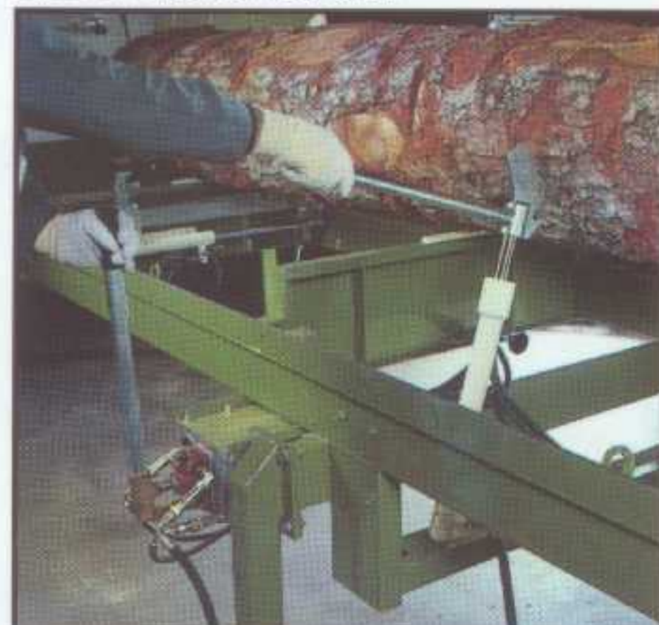
Timber Queen S tournegrume hydraulique Timber Queen S hydr. log turner