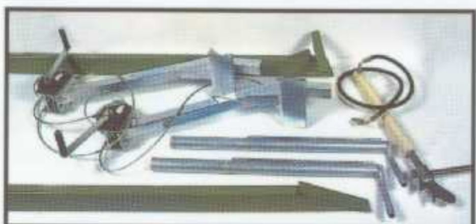
Accessoires standards pour Timber Queen S Standard accessories for Timber Queen S